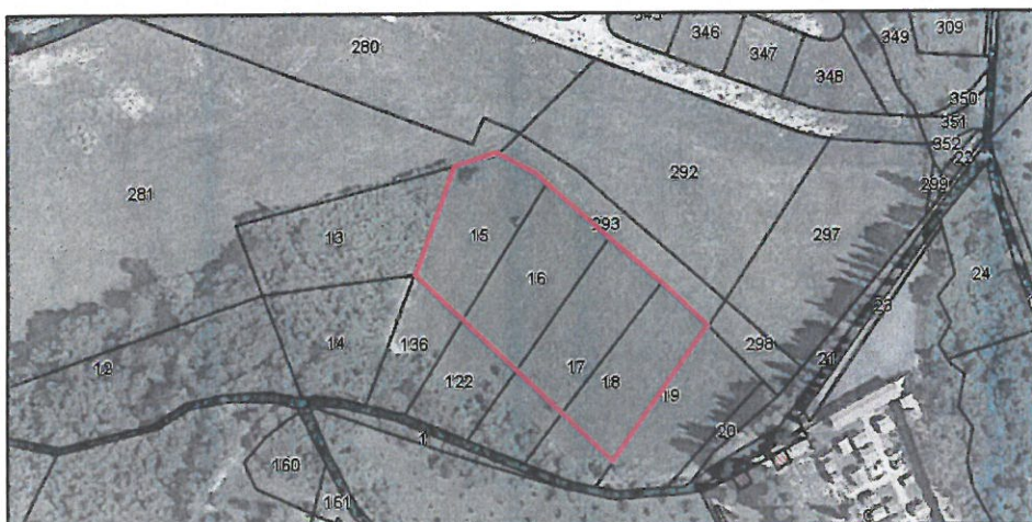
Foto aerea non in scala